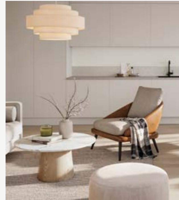
4 rok - 89-108 km