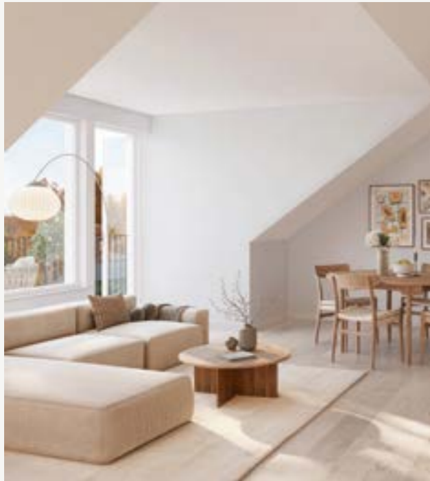
2 rok - 64-73 km

Här finns något för alla. Välj mellan våra karaktärsfulla tvåor, sociala treor, familjära fyror eller varför inte maxa med en 5 rok på rymliga 117 kvm.