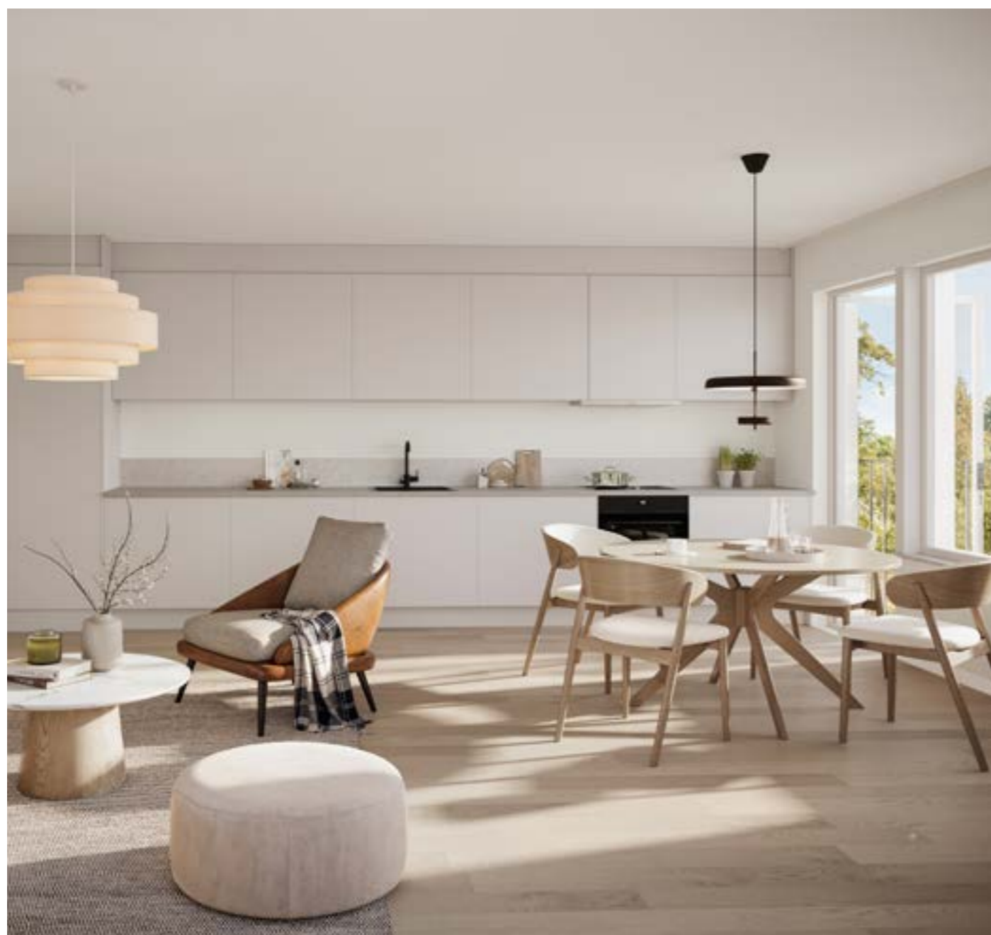
KÖK - Exklusiva kök från Ballingslöv - Genomtänkt och stilrent med tidlösa och påkostade material.

Välkommen in i din nya bostad. Ett hem med noga genomtänkt inredning, exklusiva materialval, smarta lösningar och självklart skarp design. Vi på Tindra Fastigheter tar stolthet i att med mycket omsorg skapa en helhet där alla detaljer knyts ihop och skapar en röd tråd i ditt hem.