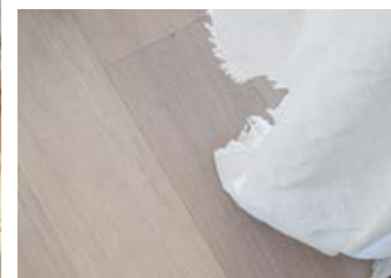
GOLV - Snygg vitpigmenterad ekparkett, 1-stav.