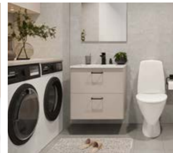
BADRUM - I badrummet kläs väggarna i ljusa färger och i inredningen har bara det bästa bjudits plats.