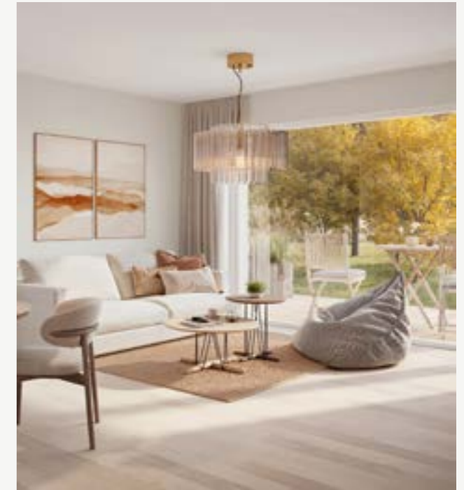
5 rok - 117 km