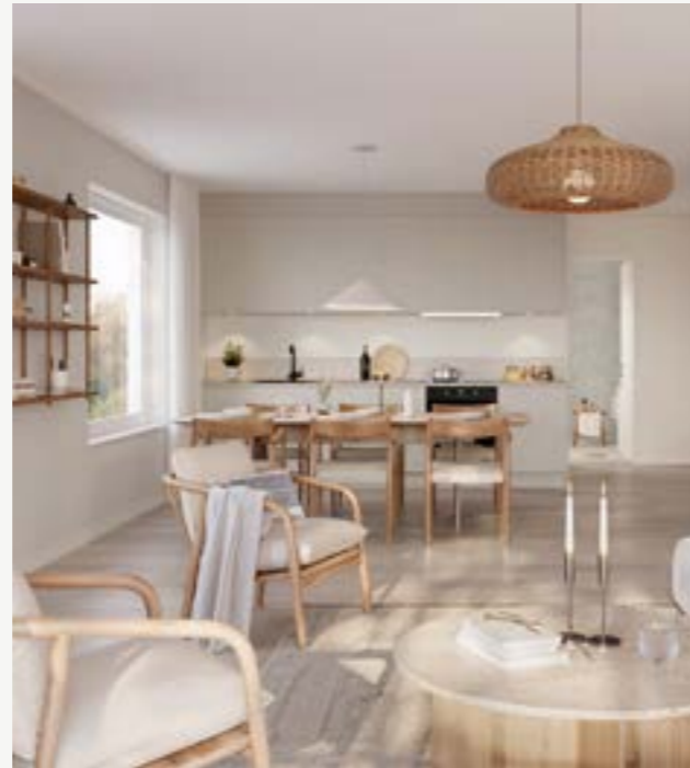
3 rok - 78-84 km