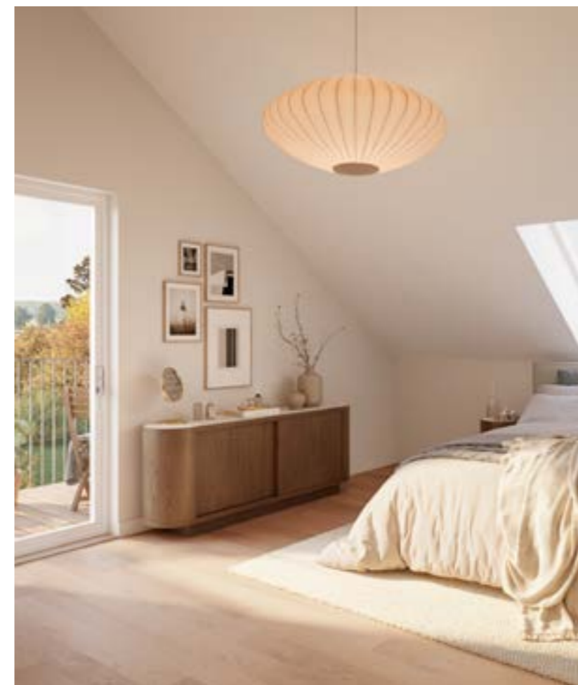
SOVRUM - Välplanerade sovrum med tilltagna fönster och förvaring.