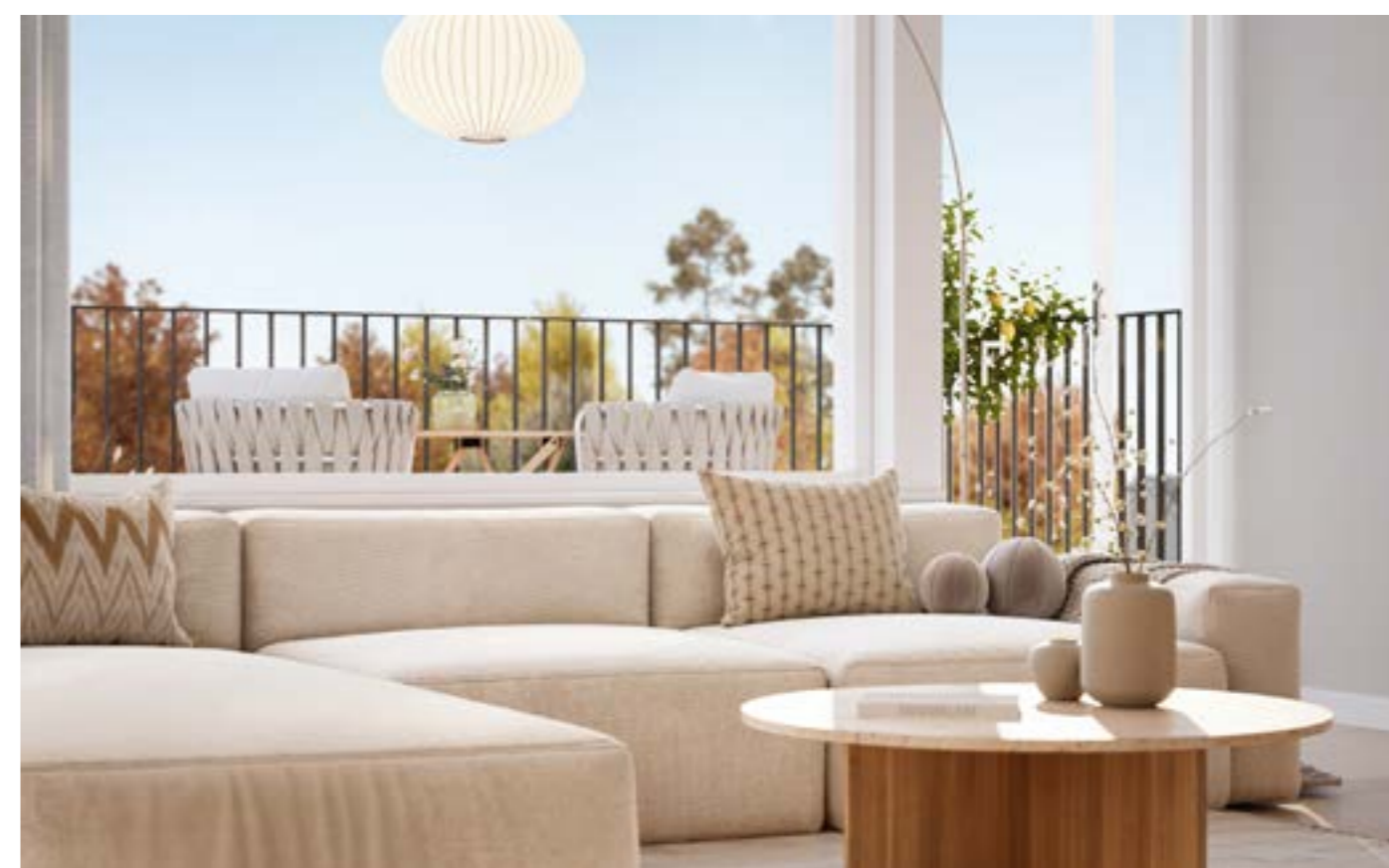
VARDAGRUM - Rummet har breda och höga fönsterpartier som tillsammans med takhöjden erbjuder en fantastisk rymd.